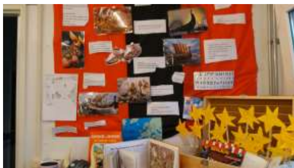
Groep 5-6 Vikingen

U hebt al in de klassen kunnen zien dat we weer aan de slag gegaan zijn met verschillende projecten. Vanaf groep 5 wordt nu geschiedenis én vanaf dit schooljaar aardrijkskunde projectmatig aangeboden. De kinderen zijn zeer betrokken bij hun eigen onderwijsontwikkeling want werken volgens deze methode geeft boeiend onderwijs! Ook in groep 1 t/m 4 worden via projecten wereld oriënterende onderwerpen aangeboden. Zo weet de middenbouw nu alles over de tandarts en de dokter!