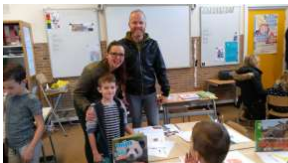
Ouders op tentoonstelling mb