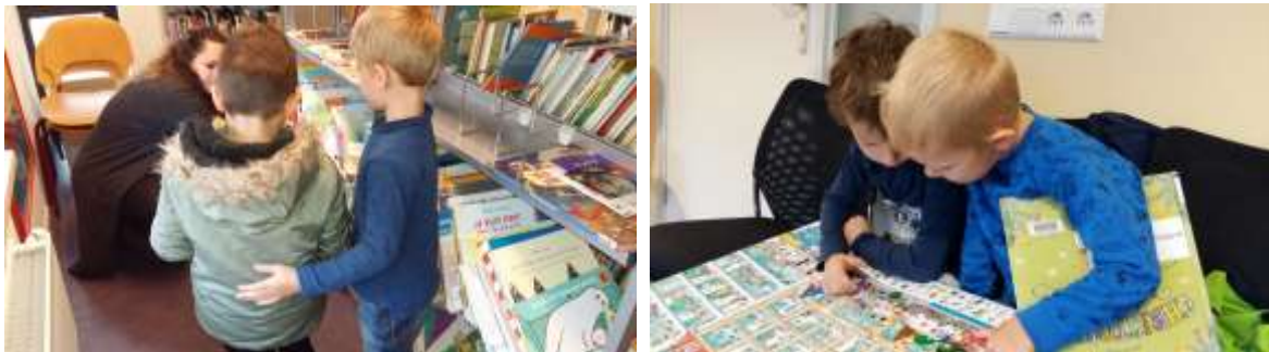
Biebbezoek met juf Alysa