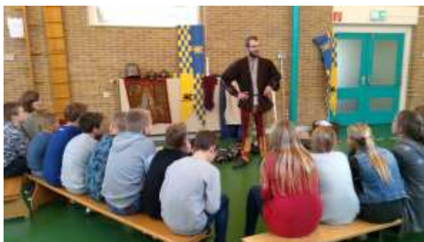
'ridder' op school