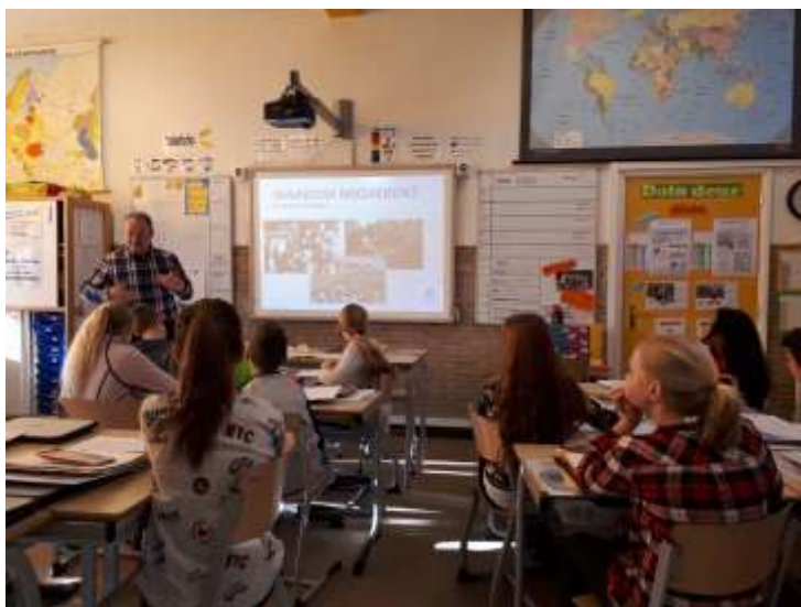
Gastles door Jan-Pieter Mostert over migratie.

Met vriendelijke groet, Cokky Schults-van Goch