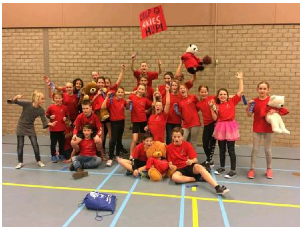
Derde prijs bij het volleybaltoernooi, eerste prijs voor de mascotte en het spandoek!

Fietsen: De fietsen van groep 7-8 worden voortaan op het nieuwe plein geplaatst in het fietsenrek. De andere fietsen worden netjes op het oude plein in de rekken geplaatst. Zo willen we de entree netjes houden.