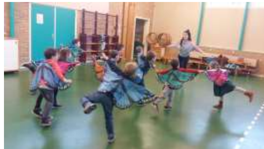
Cultuuractiviteit groep 1-2